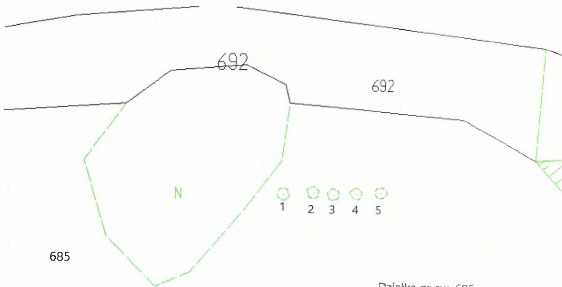
Działka nr ew. 685 zlokalizowana w m. Łajsce